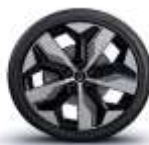
jante aliaj 20" soren