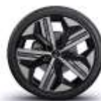
jante aliaj 20" enos

* constrangerile intre echipamentele disponibile optional pentru nivelul de echipare echilibre sunt in curs de actualizare.