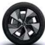
jante aliaj 18" oston